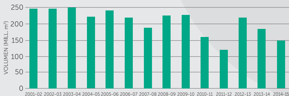
Volumen del Embalse El Yeso a Febrero de cada año (Millones m 3 )

Nota: Antecedentes obtenidos de los informes semanales enviados por la Junta de Vigilancia de la primera sección del río Maipo.